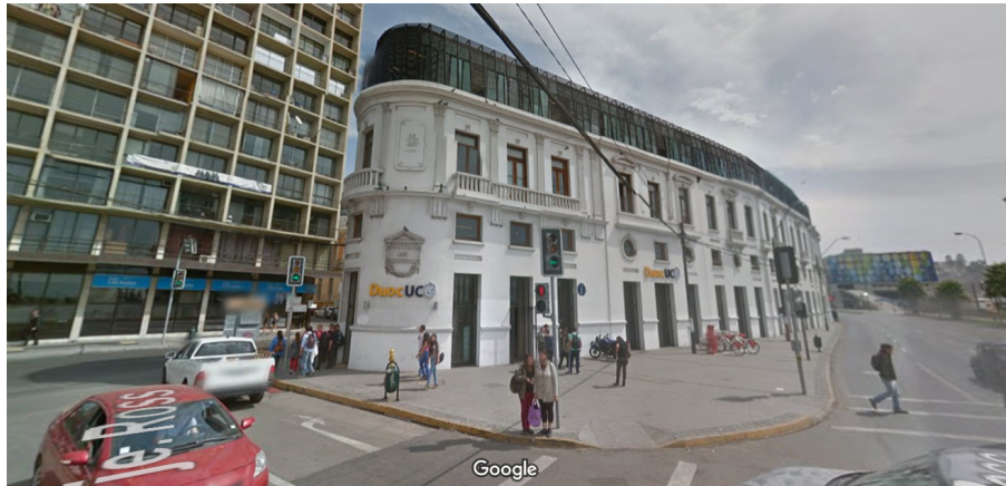
Edificio Cousiño, Centro de Extensión Duoc UC, Blanco 997, Valparaíso